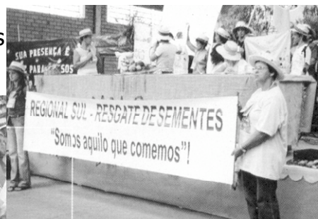
Seminario Estadual de apresentação de experiências sobre sementes criollas de hortaliças. Curitiba, Brasil, março de 2003.